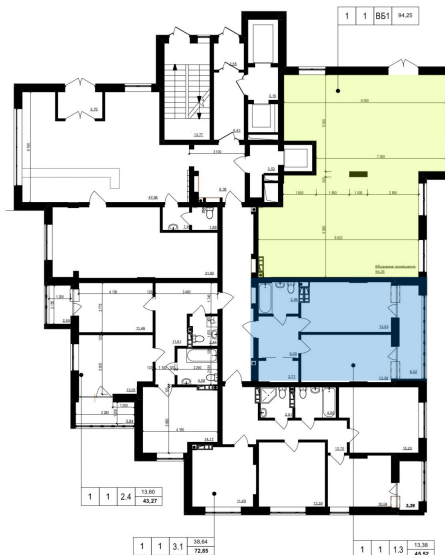
Схема розміщення на поверсі

«Повна вартість об'єкту» - сума рівна «Вартість 1 кв. м» помножена на «Уточнена загальна площа квартири».