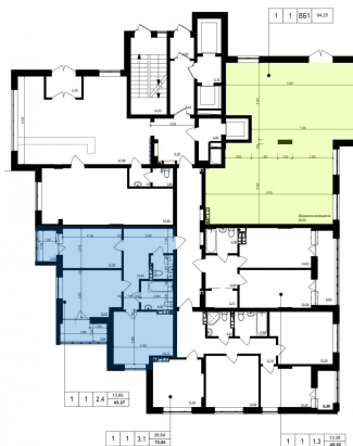
Схема розміщення на поверсі