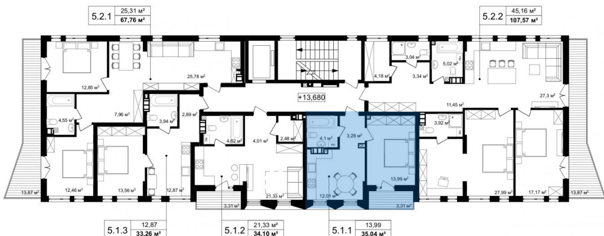
Схема розміщення на поверсі