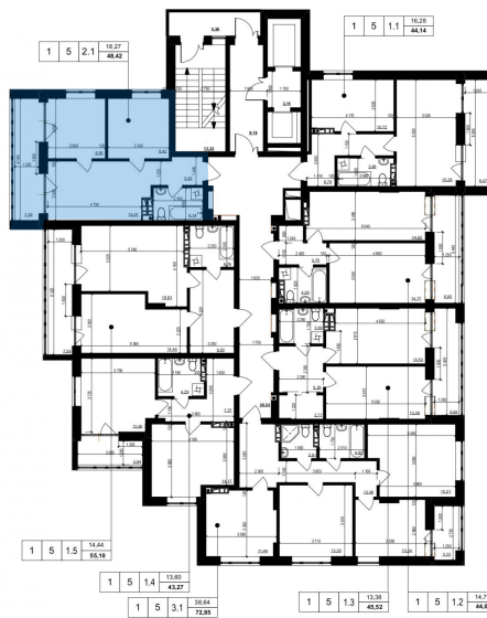
Схема розміщення на поверсі

«Повна вартість об'єкту» - сума рівна «Вартість 1 кв. м» помножена на «Уточнена загальна