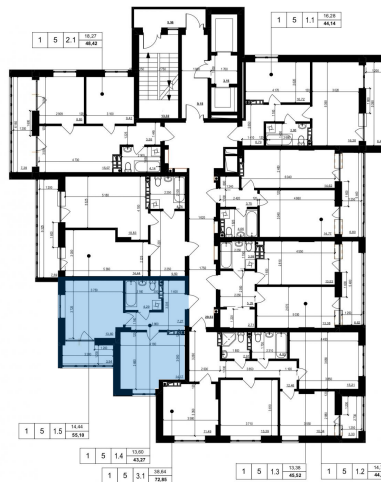
Схема розміщення на поверсі