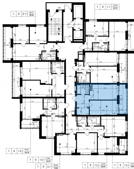
Схема розміщення на поверсі

«Повна вартість об'єкту» - сума рівна «Вартість 1 кв. м» помножена на «Уточнена загальна площа квартири».