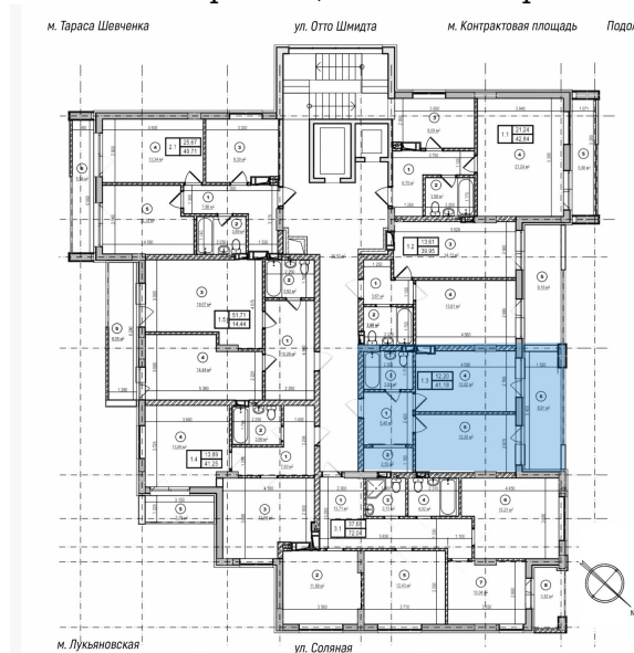
Схема розміщення на поверсі

«Повна вартість об'єкту» - сума рівна «Вартість 1 кв. м» помножена на «Уточнена загальна